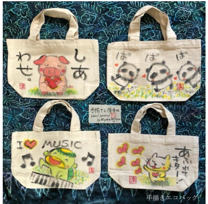
手描きエコバッグ